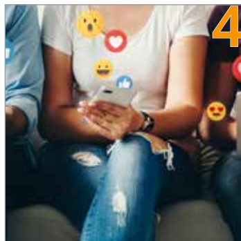
Mediensucht als neue Normalität?