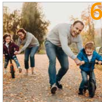
Aktiv gegen Diabetes Typ 2